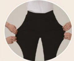
스판덱스로 쫄쫄한 신축성