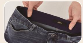
360도 허리 밴딩으로 뱃살 눌림 제로